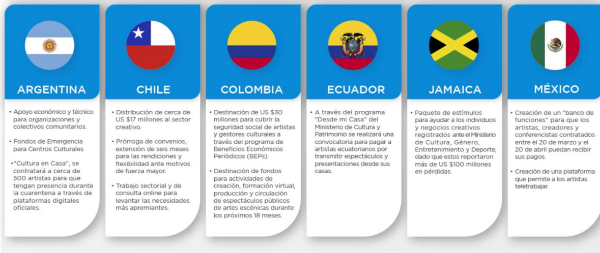
Imagen 1. (Acciones que están realizando los países en América Latina, para la reactivación de las industrias creativas)